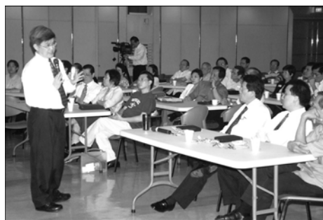
菲律賓禧年堂 深化靈命講座