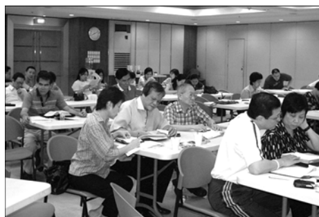
菲律賓禧年堂 實用釋經法講座