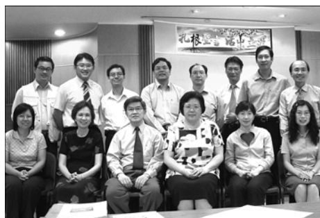
香港平安福音堂 在職牧者現代釋 經講道學課程