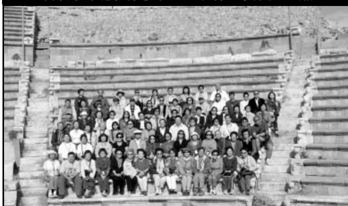
新約使徒腳蹤考察團團員在腓立比合照