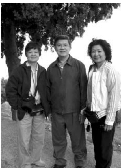
作者與賴牧師、曾熊國英師母合照