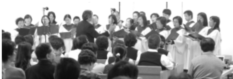
基督之家第三家詩班獻詩