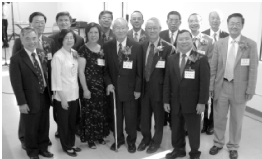
參加奉獻禮的嘉賓，董事與同工

在今年五月一日，當我們拿到這辦公室的鑰匙之後，我們幾位董事與同工腳踏在這片「土地」上，心中真有說不出來的感動與振奮。當時的感受正像詩人所說：「我們好像做夢的人！」（詩一二六1）從沒有想到 神竟然預備這樣合適理想的「家