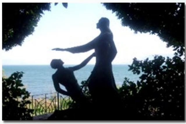
• 彼得受職堂旁邊的雕像 •

彼得受職堂旁邊有一個雕像（見附圖），是紀念主耶穌三次問彼得「你愛我嗎」的雕像。耶穌三次問彼得，第一次問「你愛我比這些更深嗎」，第二次和第三次則是問「你愛我嗎」。第一問裏的「這些」究竟何所指？可能是指打魚的漁具（用以象徵打魚的事業），也可能是指「你比其他